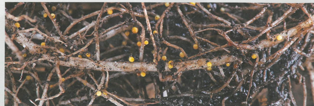
Cyster på en inficeret kartoffelplantes rødder.

NaturErhvervstyrelsen udsender brev med alle regler og retningslinjer, når der konstateres forekomst af kartoffelcystenematoder i en mark.